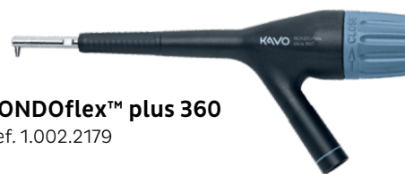
RONDOflex™ plus 360 Ref. 1.002.2179

Ref. 3.002.8000 Blauw - (KaVo Koppeling) Ref. 3.002.8200 Geel - (KaVo Koppeling) Ref. 3.002.8800 Roze - (KaVo Koppeling) Ref. 3.004.5900 Blauw - (Sirona Koppeling) Ref. 3.004.5930 Geel - (Sirona Koppeling) Ref. 3.004.5950 Roze - (Sirona Koppeling)